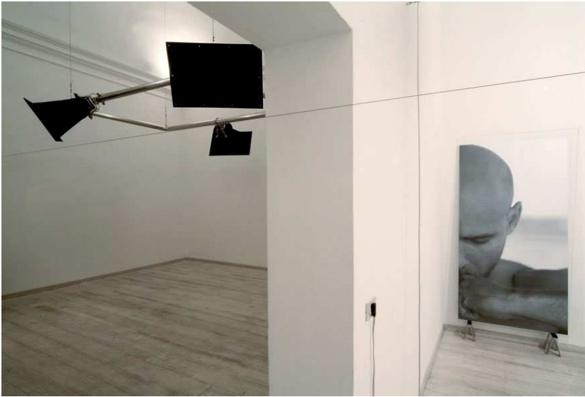
oTTo gallery, Bologna, 2005