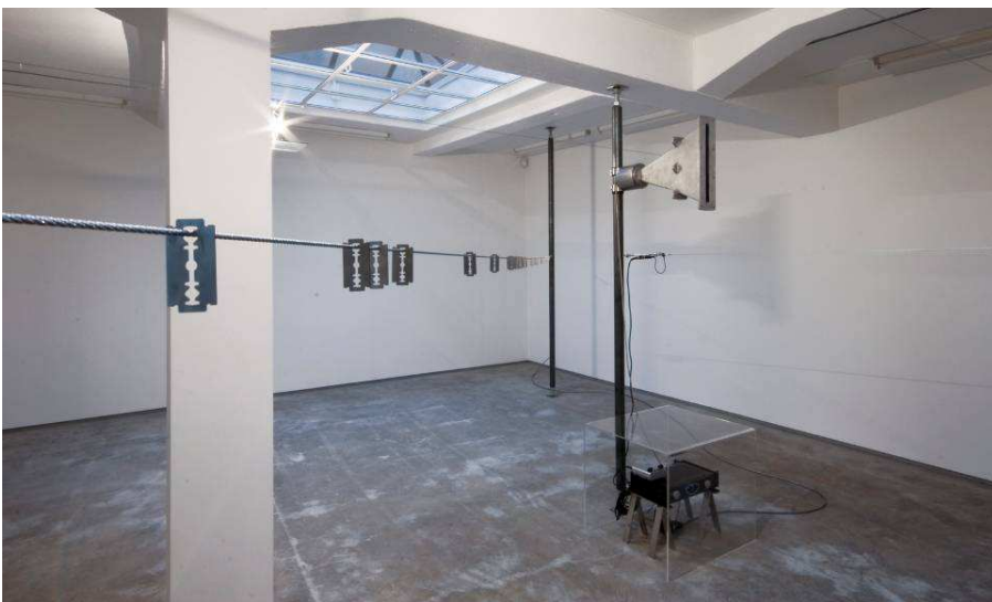
Galleri MGM, Oslo, 2007