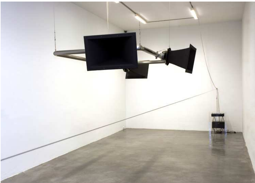
Galería Oliva Arauna, Madrid, 2006