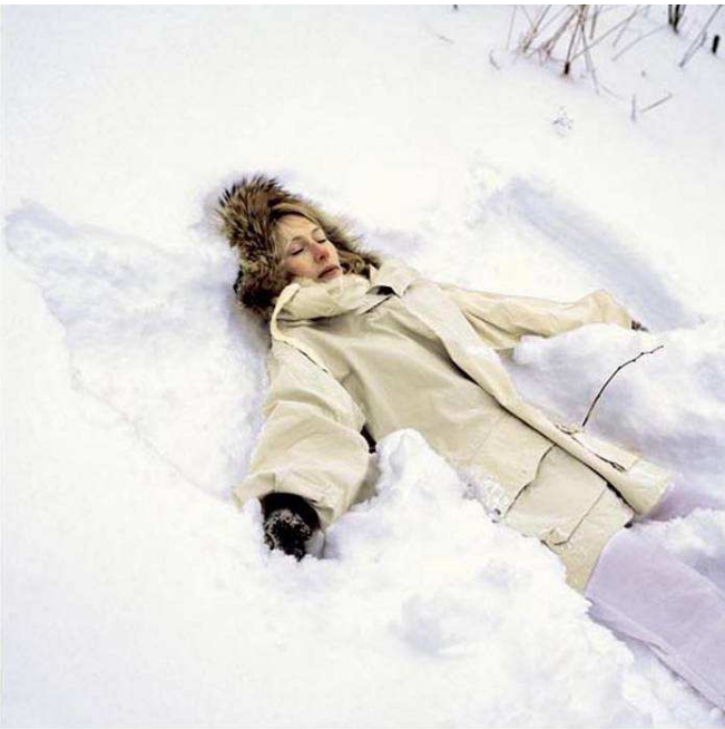
Ashild , 2005, courtesy Galería Oliva Arauna, Madrid