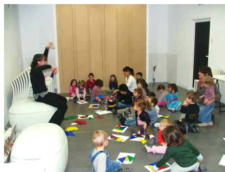
Visite – atelier au musée dans le cadre du service éducatif