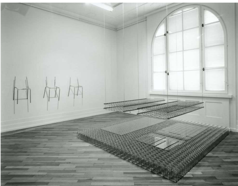
Ragna St. Ingadóttir, Hangover , Musée d'art contemporain d'Oslo, Norvège