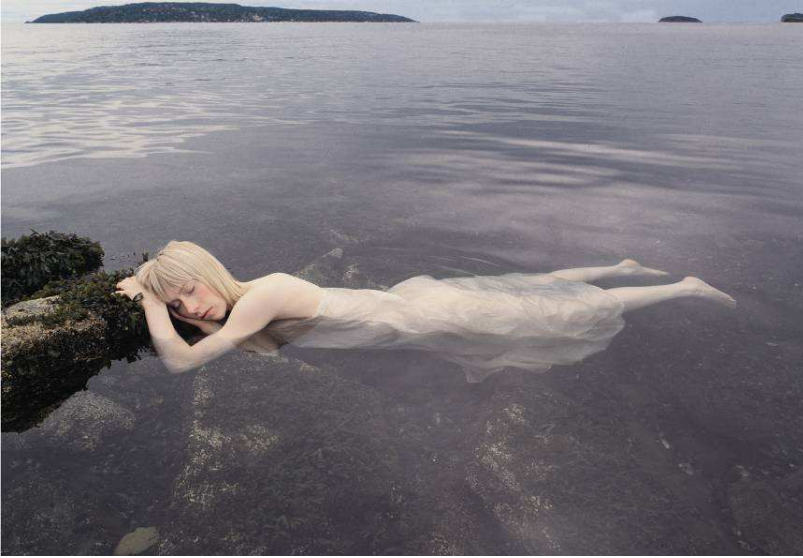
Ashild , 185 x 265 cm, 2005